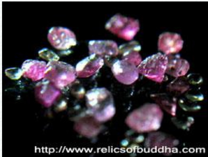
พระธาตุ ของหลวงพ่อพระราชพรหมยาน วัดจันทาราม(ท่าซุง) จ.อุทัยธานี