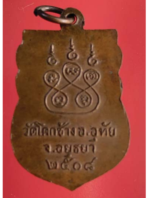
เหรียญรุ่นแรก หลวงปู่สี วัดโคกช้าง ลพ.เงิน วัดดอนยายหอม-เสก ปี 08