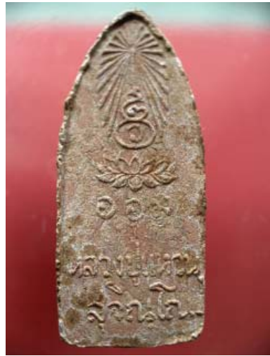
พระลีลาทุ่งเศรษฐี-ลป.แหวน